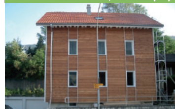
Maison familiale, Court (JU)