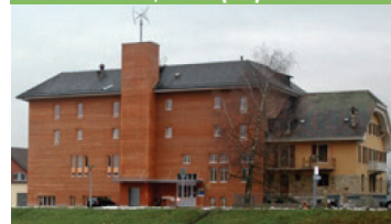
Bâtiment administratif, Yverdon (VD)