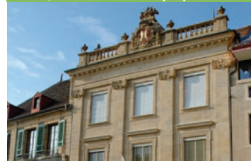
Hôtel de Ville, Orbe (VD)