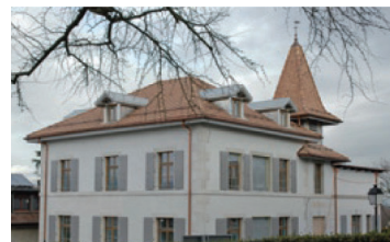
École, Grand-Saconnex (GE)